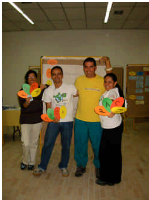
PACA Capacitación en Pereira/ Colombia: El equipo ganador del concurso PACA Spots.

Me emocionó aún más, cuando revisé la información que los organizadores del evento enviaron por correo electrónico, y al leer su contenido se me hacía mucho más fácil entender que es PACA, pero siempre hay la gran diferencia entre la lectura que uno hace y la aplicación.