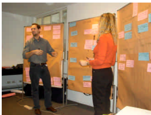
Estudiantes de la maestría en Buenos Aires

Hoy en día en varias universidades el desarrollo local es una materia que se puede estudiar. Normalmente se trata de cursos de postgrado en que participan, sobre todo, profesionales con experiencias que quieren profundizar sus conocimientos. Dos ejemplos para América Latina son: (1) La Maestría en Decentralización y Desarrollo Local que organiza la Universidad de las Américas ( http://www.uamericas.edu.ec ) con soporte de la Agencia Alemana de Cooperación Técnica (GTZ) en Quito/ Ecuador y (2) la Maestría de Desarrollo Local que organiza la Universidad Nacional de San Martín