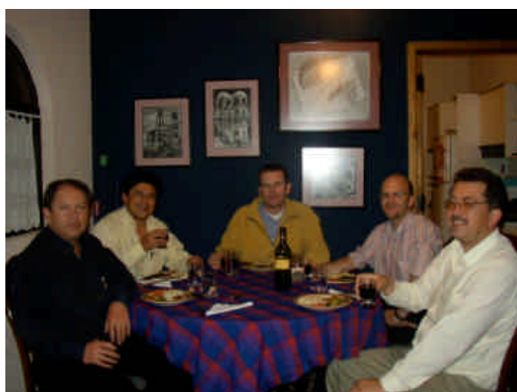
Los socios-fundadores celebrando la creación de RECORD Asesores Ltd.