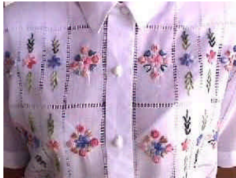
Un bordado típico de Cartago

En los momentos que escribo esta reseña, el equipo PACA debe estar concluyendo su análisis de resultados y la elaboración de las propuestas